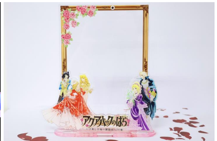
※オリジナルアクリルフォトスタンドも別途販売します。 ¥3,500